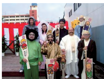
やっちろ笑店街の八福神