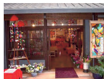
ざぼネーゼによる雛飾り