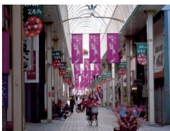
八代本町一丁目商店街